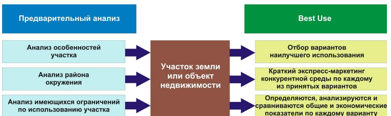
Рисунок 2 Условная схема проведения анализа наилучшего использования участка земли или объекта недвижимости

Работы фирмы «Урал-Гермес» неоднократно отмечались наградами Администрации г. Екатеринбурга и Правительства Свердловской области. Компания является номинантом всероссийской премии «Российский национальный Олимп».