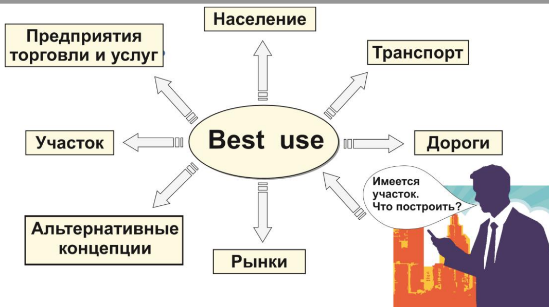
Рисунок 1 Постановка проблемы